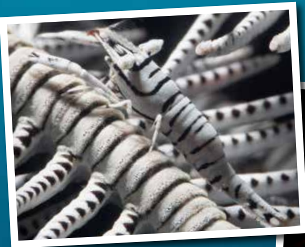
Goed kijken! Het garniaaltje is amper een centimeter groot en goed gecamoufleerd.