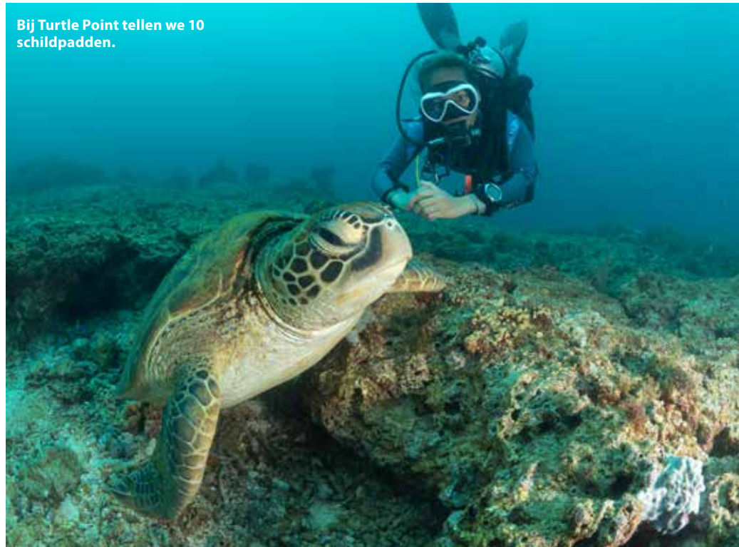
Bij Turtle Point tellen we 10 schildpadden.

omgeven door palmbomen. Wat een prachtige natuur is het hier. In de vallei leven makaken. Onze lunch hebben we in het plaatsje Loboc. We vertrekken