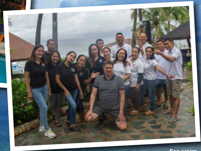
Een warm ontvangst van de crew!