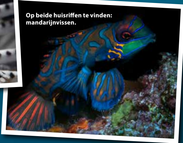
Op beide huisriffen te vinden: mandarijnvisjes.