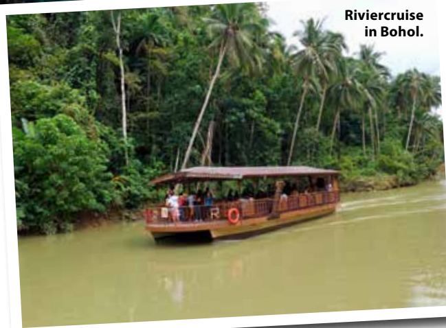
Riviercruise in Bohol.

Om 6.00 uur zet ik de wekker. We gaan naar Oslob, waar we gaan duiken met de walvishaaien. Het is